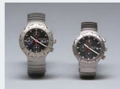
Original und Fälschung // original and copy